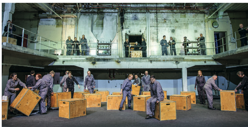
... und so, wie es heute genutzt wird, beispielsweise mit einer «Erlebnisoper».